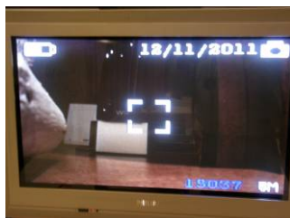
Détection de mouvement : capture photo

Pressez brièvement le bouton mode pour passer en mode moniteur prise de photo en détection de mouvement (LED jaune et rouge allumée). Quand un objet mobile apparaît la camera prend une photo.