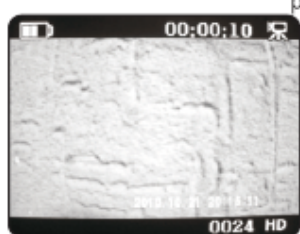
TV Video& Audio Playback_Video

Allumez la caméra. Après quelques secondes, les LED rouge et bleue s'allument et la dernière photo ou vidéo apparaît sur la TV.