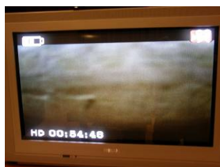
Détection de mouvement : enregistrement vidéo

Pressez brièvement le bouton mode pour passer en mode moniteur prise de photo en détection de mouvement (LED jaune et rouge allumée). Quand un objet mobile apparaît la camera prend une photo.