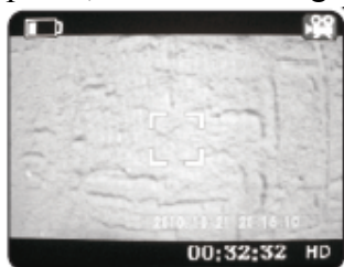
Motion-detect recording standby

Connectez la caméra au câble AV. Après quelques secondes la vidéo apparaît à l'écran. En même temps, la caméra entre en mode d'enregistrement intelligent. Quand un objet mobile apparaît, la caméra enregistre pendant 10 secondes.